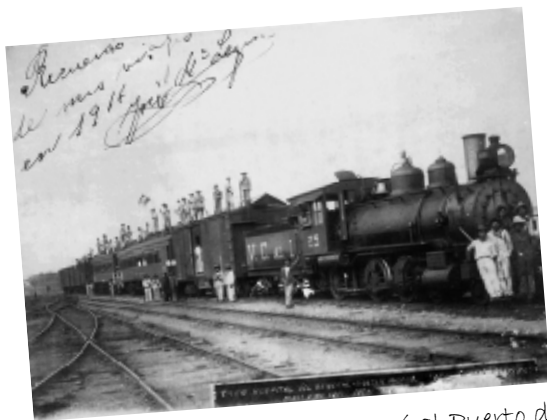
Hospital Ambulante que llegó al Puerto de Coatzacoalcos durante la época de Revolución.