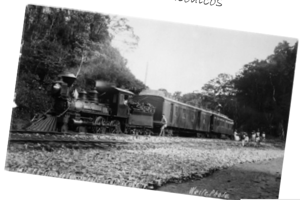
Convoy del FC del Istmo de Tehuantepec con su locomotora de vapor 4-4-0 usadas por curvas de montaña en su trayecto Salina Cruz-Coatzacoalcos