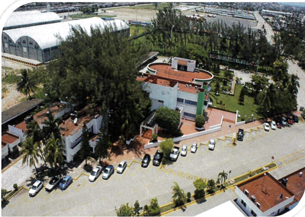
(Actualización aprobada 2ª reunión extraordinaria del CEPCI 28/03/2018)

Protocolo de atención de quejas y denuncias por incumplimiento al Código de Ética, las Reglas de Integridad y al Código de Conducta de la Administración Portuaria Integral de Coatzacoalcos, S.A de C.V.